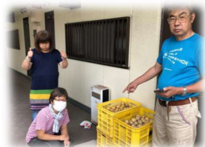
収穫したじゃがいもを子ども食堂へ