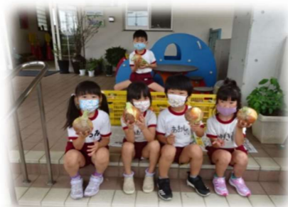
収穫した玉ねぎを山直南こども園へ

今後のイベントにつきましては、政府の動向に注視しながら、運営委員会や各部会で開催を検討していきます。詳細については、まちづくり協議会のホームページで随時お知らせします。