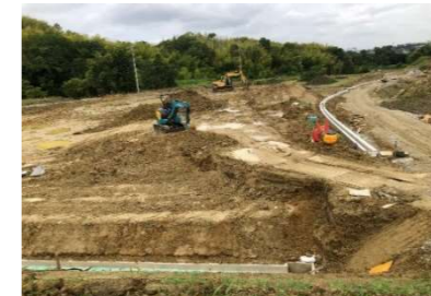
B-2 工区農地整備状況