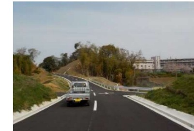
C工区集落道路 （岸の丘神於山線）供用開始