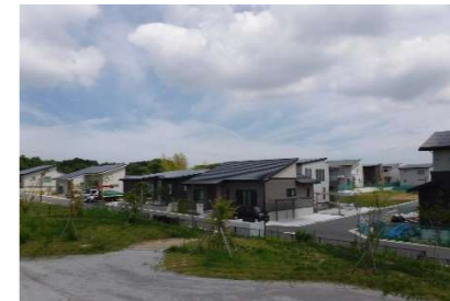
住宅地のまちなみ