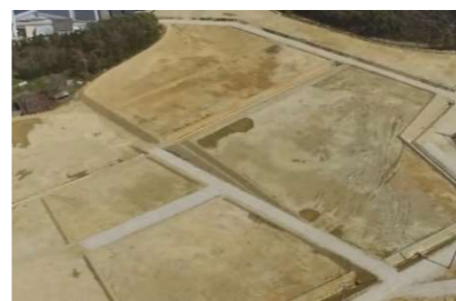
A-3 工区農地整備状況

また、各工区においては農地やため池、集落道路等の整備工事が行われており、令和3年 10 月には全工区において営農が開始できる見込みです