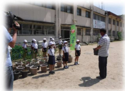
お茶畑再生プロジェクト (協力：(株)伊藤園)