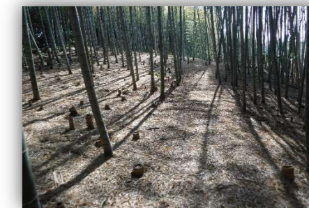
整備されたタケノコ山

竹伐採、植樹イベント等により少しずつですが里山が整備されてきています。今後もみなさまの手を借りながら里山保全活動に取り組んでいきます。