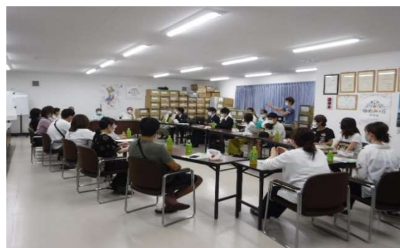
住民説明会の様子

7月10日（金曜日）に居住者部会と株式会社一条工務店を交え、新規住民のための住民説明会を開催し、10世帯もの新規住民の参加がありました。まちづくり協議会の活動や今後のまちづくりについて説明し、新規住民からは通学路や防犯カメラの設置状況についての質問があるなど、活発な意見交換がなされました。