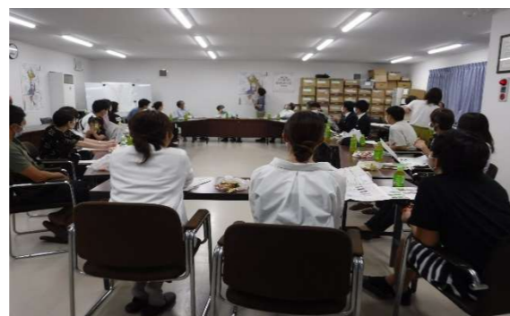
住民の質問に答える事務局