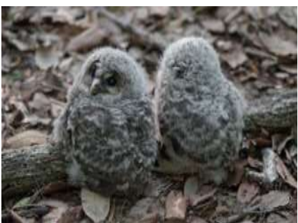
写真 自然エリア(巣箱で生まれた雛)