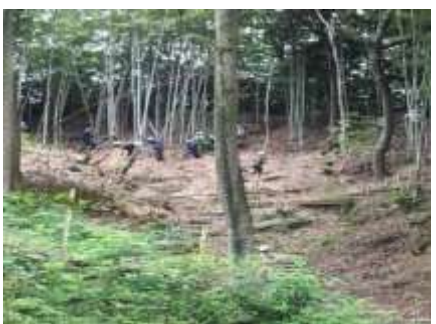
写真 自然エリア(アドプトフォレスト活動)