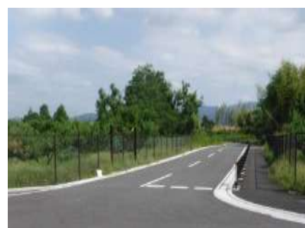
写真 供用された区画道路