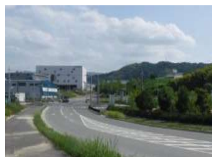
写真 業務エリア(立ち並ぶ企業)

「自然エリア」については、アドプトフォレスト活動等により、荒廃竹林が整備され、少しずつですが里山再生が進んでいます。また、今年も春には自然エリア内の巣箱にて、フクロウの産卵が確認され、卵から無事に雛が生まれ、元気に巣立ちました。