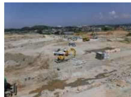
写真 住宅エリア(造成工事中)