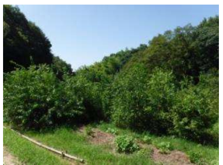
写真 自然エリア(里山再生中)