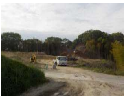
写真 農エリア(集落道造成工事)