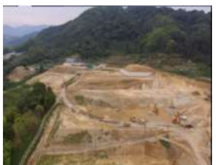
写真 農エリア(C-1 工区造成完了)