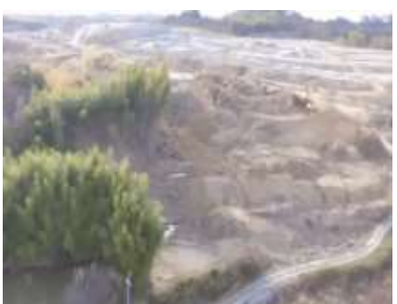
写真 農エリア(A-3 工区伐採状況)