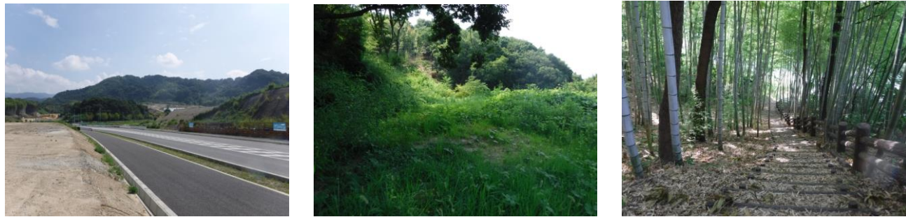
写真 府道春木岸和田線の状況 写真 自然エリアの状況 写真 竹林の状況(展望台への階段)