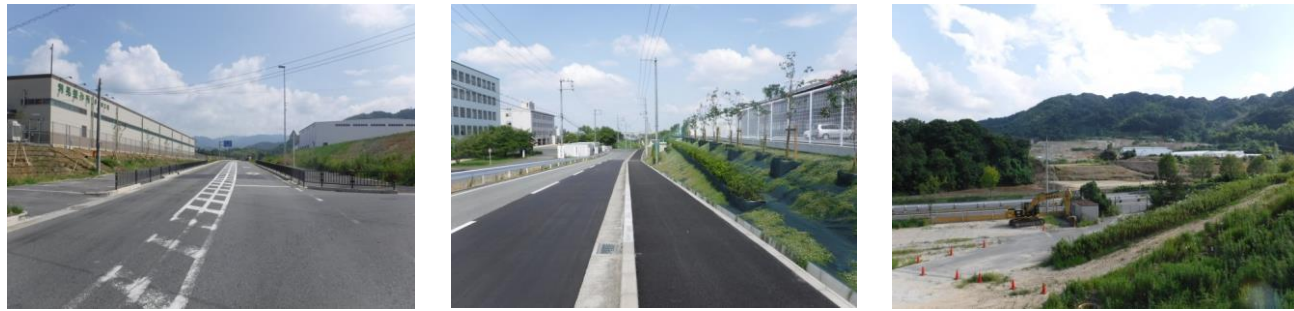
写真 旧事務所前交差点の状況 写真 市道稲葉町 20 号線の状況 写真 造成状況(都市から農を望む)

ゆめみヶ丘岸和田では着々と事業が進捗しています。都市エリアでは企業の建築工事も進んでおり、すでに操業を開始されている企業もあります。また農エリアでも造成等が進んでいることが確認できます。自然エリアでも緑が生い茂り、夏らしい風景になっています（草刈りはとても大変ですが…）。都市、農、自然。ゆめみヶ丘岸和田のまちなみは日々変化しています。