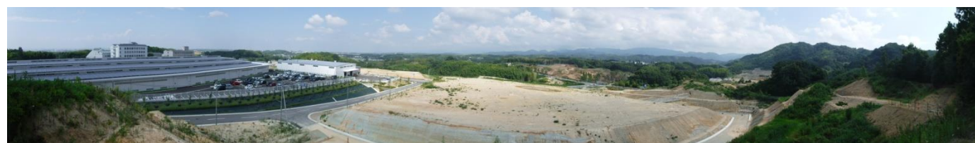
写真 高台からの状況