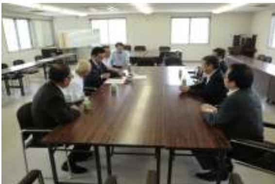
業務代行基本契約調印の様子