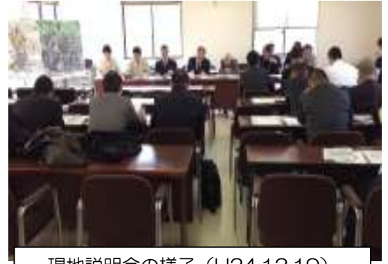
現地説明会の様子（H24.12.19）

12月19日（水）の現地説明会以降、参加意向登録書の提出および事業提案書の提出までが終了し、1社（㈱竹中土木 大阪本店）より提案資料を提出いただきました。