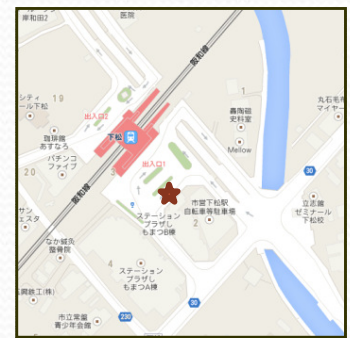
下松駅集合場所 9:25 (ロータリー内)