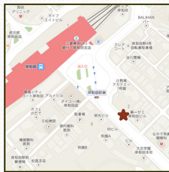
岸和田駅集合場所 9:05 (第一ゼミナール前)

15:30 山直神社社寺林 15:45 丘陵地区現場事務所 16:00 JR下松駅 16:15 南海岸和田駅 16:30 市役所新館前