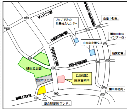
丘陵地区現場事務所

作業を行う山直神社社寺林付近は、駐車できるスペースが少ないため、現場事務所からマイクロバスで移動します。